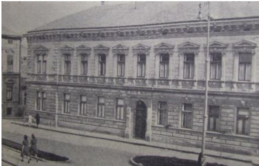
2. kép – A Stomatologiai Intézet épülete Pécsen, a hajdani Ferenciek utcája 33. alatt, a rendelőt az első emeleten rendezték be