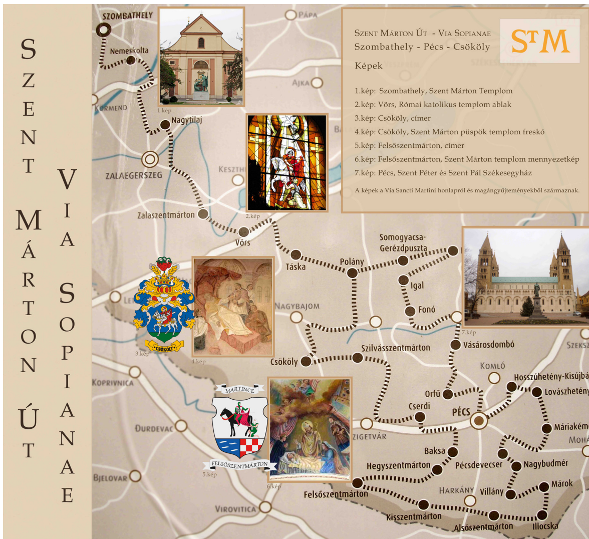
Szent Márton Út